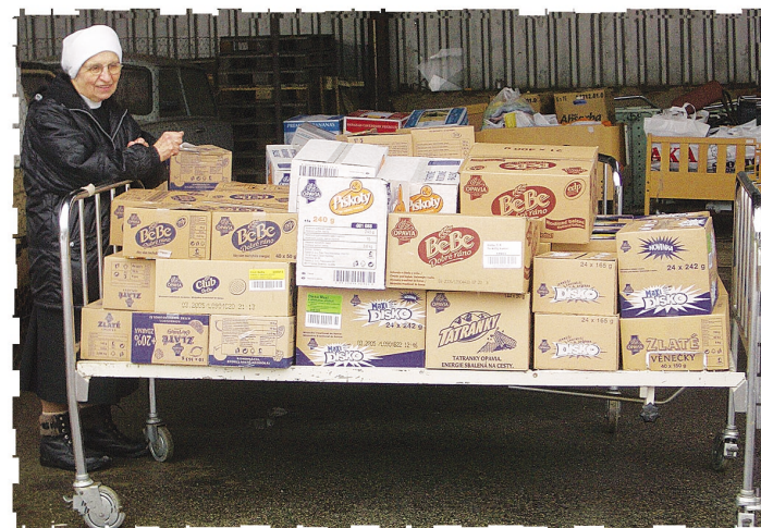
Obr. 5 Sladké obdarování – Opavia sušenky

V roce 2004 nadace získala z oblasti zdravotnických pomůcek: 118 chodítek, 108 zdravotních nástavců na WC, 58 zdravotních postelí, 89 invalidních vozíků, 12 zvedáků, 16 opěrek a invalidních křesel, 39 sprchovacích židlí. Dále nadace obdržela 35 nábytkových souprav, 206 židlí, 298 stolů, 199 skříní a skřínek, 45 regálů, 2349 ks různého prádla, povlaků, osušek a 3050 ks nádobí. Potraviny jako jsou např. sušenky, ovoce, pečivo, káva, čaj, získává nadace sponzorskou od různých domácích firem.