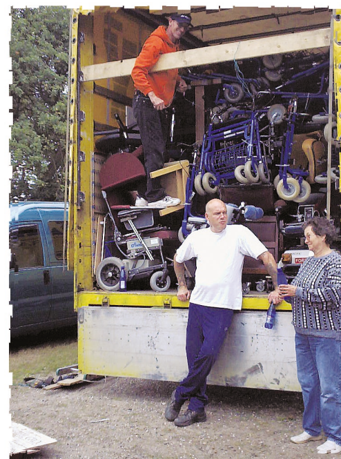
Obr. 6 Přátelé z holandské nadace

Hotel Pyramida, a.s. – lůžkoviny a jiné prádlo Hotel Axia, a.s. – stolní a ložní prádlo Nadace Olga Havel – Holandsko – zdravotnické pomůcky, nábytek, ošacení Agape Foundation – Švédsko – zdravotnické pomůcky, nábytek Karlovarský porcelán, a.s. závod Lubenec – jídelní nádobí Karlovarský porcelán, a.s. závod Nová Role – jídelní nádobí Hotelový porcelán, Karlovy Vary – jídelní a servírovací nádobí Danone Opavia, a.s. – sušenky, cukrovinky Douwe Egberts – káva, čaj Chiquita Banana co. – banány Jídelní a lůžkové vozy, a.s. – Praha, potraviny Karmelitánské nakladatelství – kalendáře a tiskoviny Naděje, Praha – potraviny Vojanovy sady Praha – květinové sazenice Penzijní fond Stabilita – nábytek Poradna pro rodinu, Praha – nábytek T.D.Line, s.r.o. – Brandýs n/L. – koupelnové zařizovací doplňky