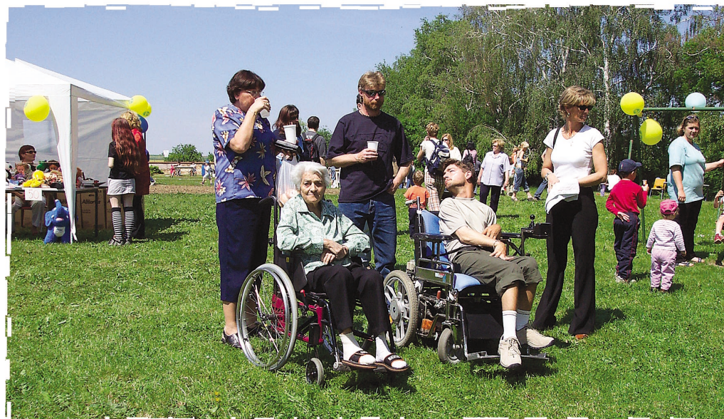
Obr. 2 – Dary od nadace potěšily nejen děti na dětském dnu v Řepích

Rozsáhlý sociální program Diakonie Beránek v Liberci zahrnuje mnohostrannou činnost, kterou nadace dlouhodobě sleduje. V této fázi přispěla na podporu části programu „Seniorům ku pomoci“ na jeho administrativní zajištění.