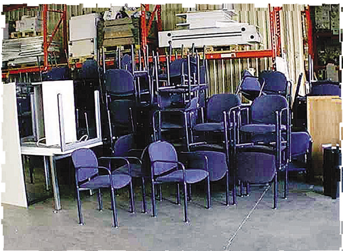
Obr. 3 Sklad zdravotních pomůcek a mnoha dalších užitečných věcí

U těch projektů, kde byl žádán finanční příspěvek na nákup zařízení, nebo zdravotních pomůcek, které má nadace k dispozici v naturální formě, byla žadatelům nabídnuta i přímá pomoc ve formě věcného daru.