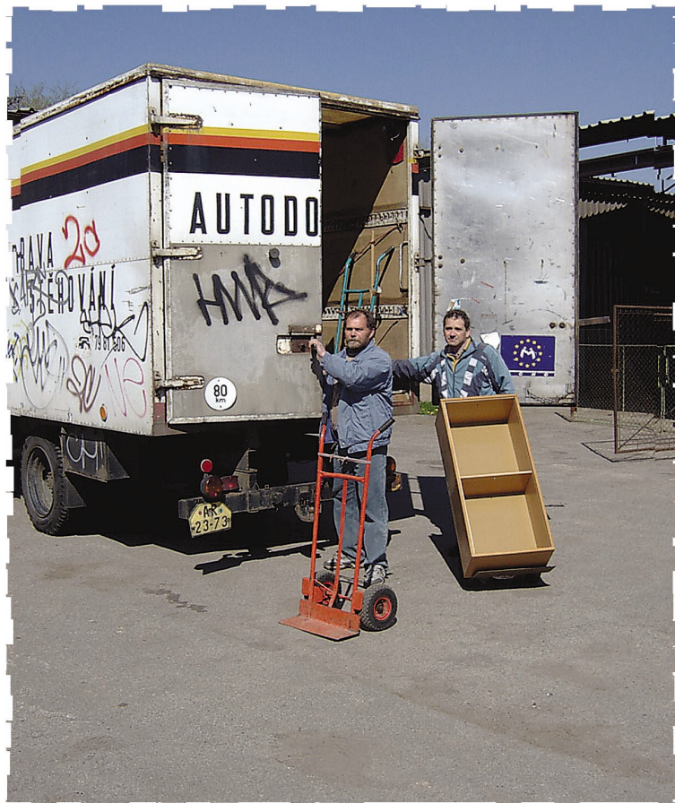
Obr. 7 Pomocníci nadace

Dorkas, o.s. – administrativní práce a kontakty s dárci a sponzory