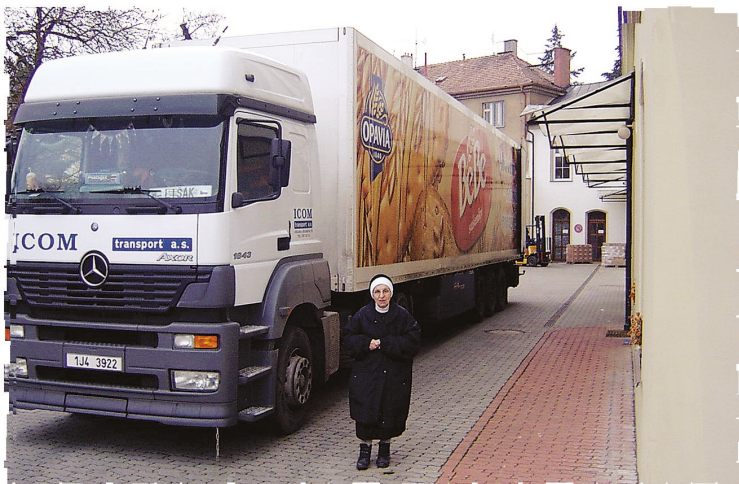
Obr. 4 Velká zásilka

Paralelně s tím, jak se stává pro nadaci stále obtížnější získávat finanční prostředky, roste další oblast nadačního působení, a to přímá podpora potřebných věcnými dary. Mnohaleté soustavné rozvíjení vhodných kontaktů přináší své ovoce. Ze zahraničí i z domova, od firem, institucí i jednotlivců získala nadace i v roce 2004 mnoho hodnotných materiálních darů, kterými podpořila ústavy, občanská sdružení a řadu dalších nestátních neziskových organizací i jednotlivců. Protože ve většině případů jde o věci, které nadace přebírá jako dar nebo ve zbytkové účetní hodnotě, nelze finančně vyjádřit reálnou cenu těchto věcných darů pro příjemce, kterým je takto umožněno získat věci, které by jinak byly pro ně